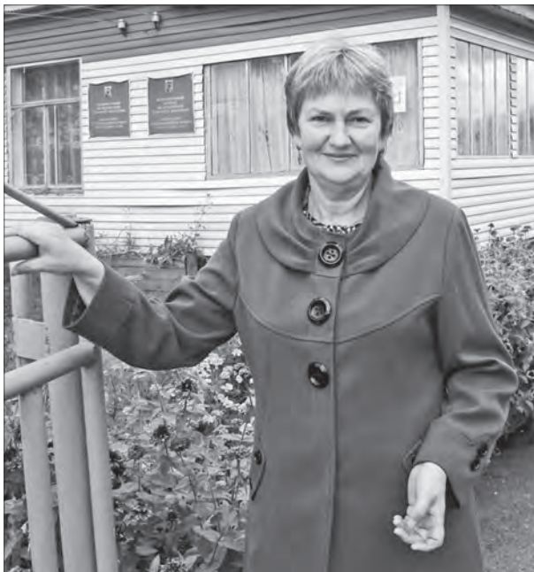
на рабочем месте, а объемы от этого едва уменьшатся.

В кабинете она, чтобы не терять времени, снова погружается в отчеты, сметы, счета и звонки. Бумажная работа – это «праздник, который всегда с тобой». Хотя ночью